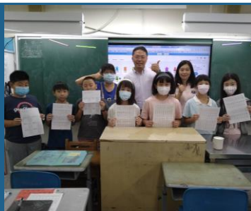
暑期營隊、多語文訓練