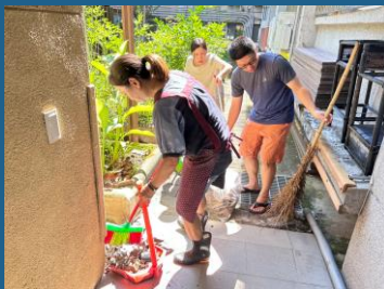
開學前總動員清潔校園