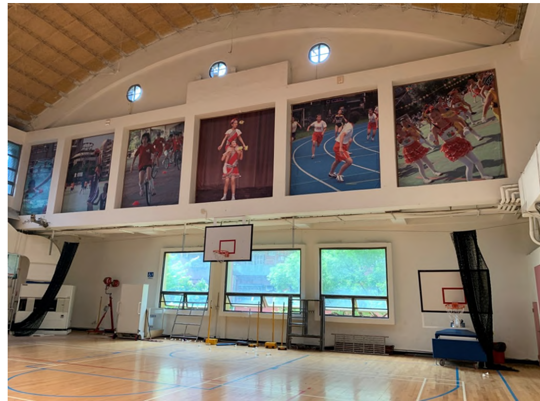
寬敞採光 校史特色